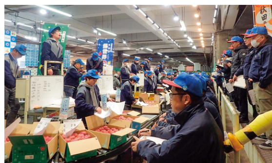
▲トッパセールス後の競売（大果大阪青果）