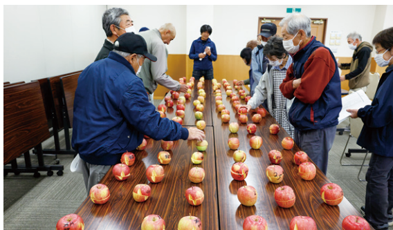
▲部会員らが提出したサンプルを確認する参加者

葉とらずりんごは、収穫前に果実の周りの葉を摘まずに育てたりんごで、葉を残すことで、葉から果実へより多くの養分が送られ、甘みが強くジューシーになります。目揃え会では会員が提出したサンプル111点を確認しながら出荷規格や品質について確認しました。