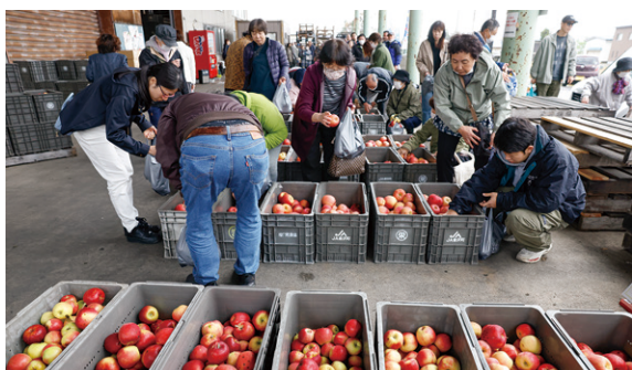
▲大盛況となったりんご・西洋ナシの詰め放題

同実行委員会が主催し同市のりんごを県内外にPRし、消費拡大を図る目的で毎年開催しています。今年からりんご・西洋ナシの詰め放題がJ Aの金麓園選果場を会場に行われ、広くなった会場には約300人が訪れ870袋を売り上げ、大盛況となりました。