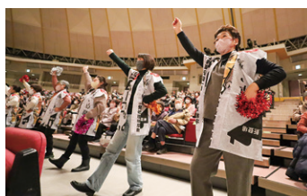
▲会場が盛り上がった100ダン!