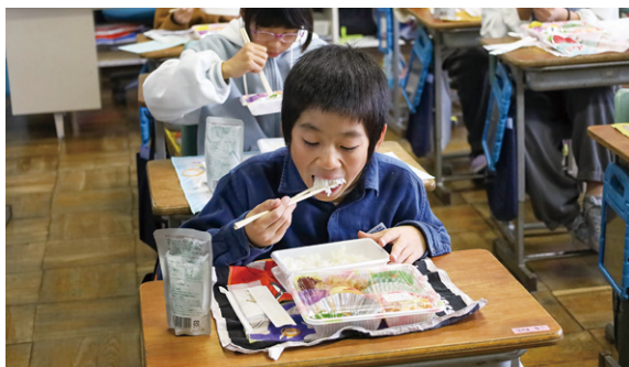
▲「サキホコレ」を頬張る増田小学校の児童

今年度の稲作の学習をまとめた発表会では、生徒、児童による農産物栽培の振り返りも行われ、交流を深めました。