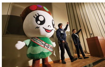
▲ふるっぴもダンス!