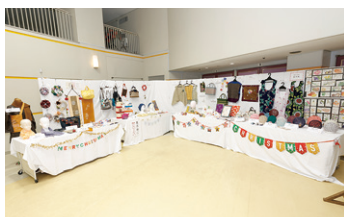
▲女性部活動作品の展示